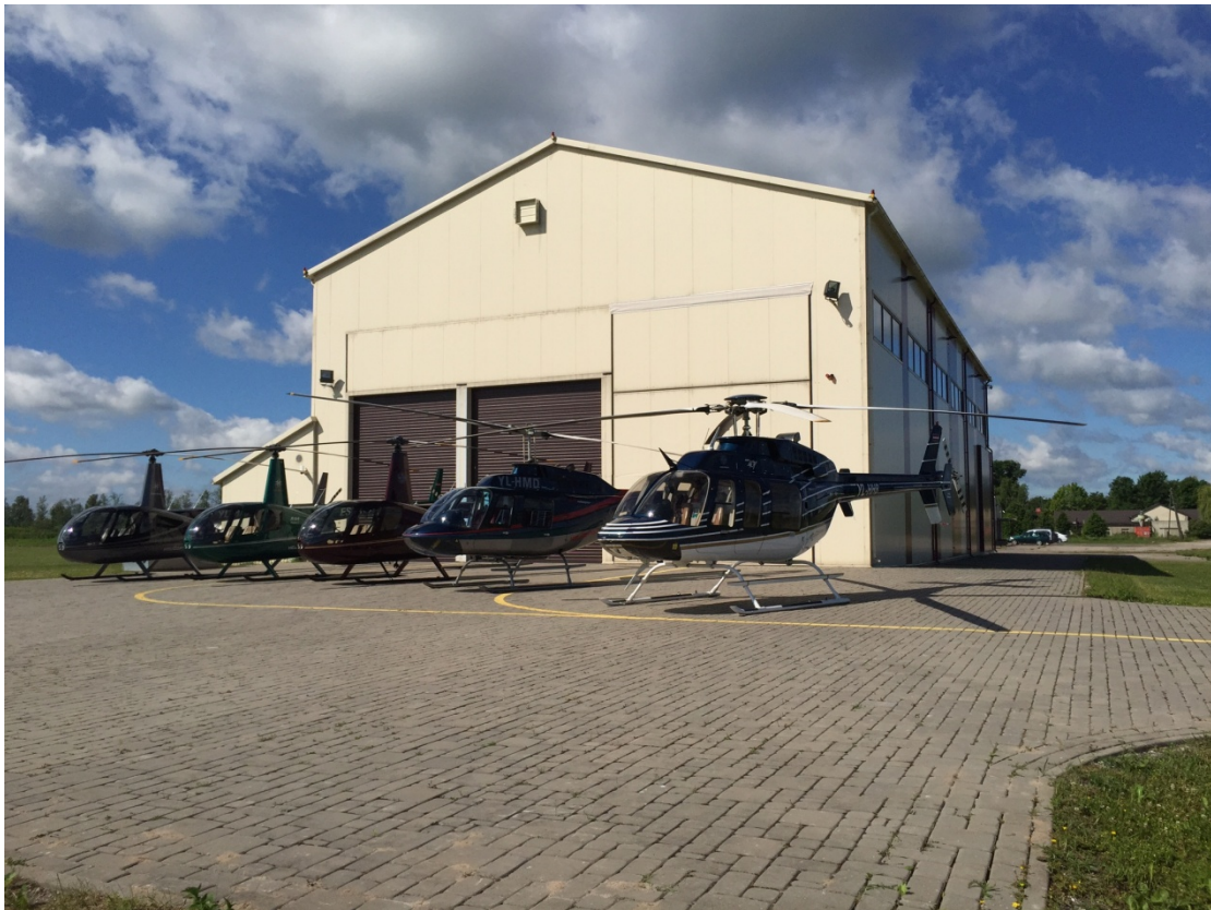
Foto Nr.9 PART 145 (starptautiskais sertifikāts) helikopteru atbalsta centrs Nākotnē.