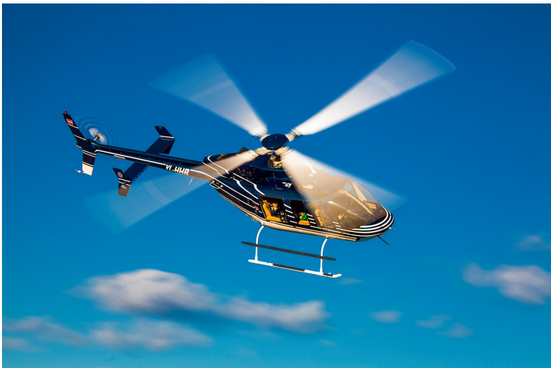
Foto Nr.10 Helikopters BELL 407VIP (ādas sēdekļi un iespēja pasažieriem lidot bez troksni slāpējošām austiņām)