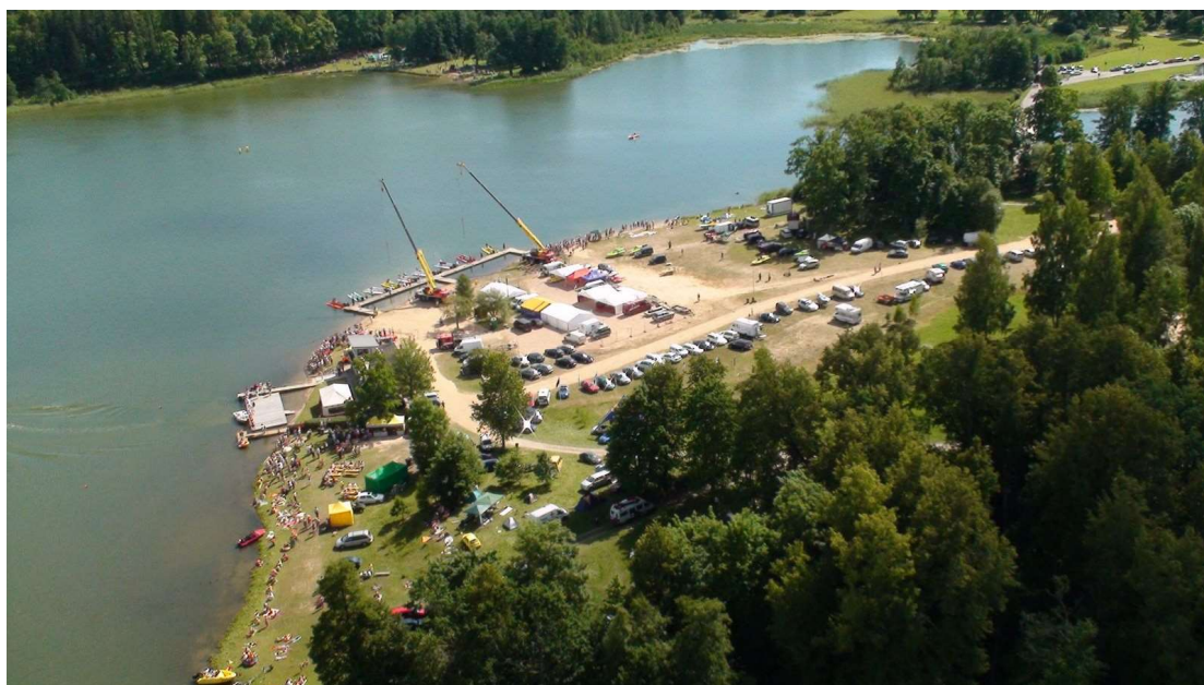
Foto Nr.14 Sacensību vieta no augšas Alūksnes ezerā