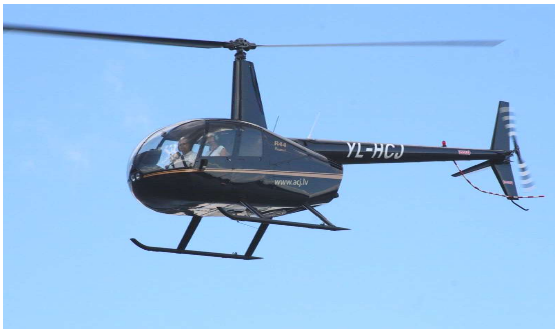
Foto Nr.13 Alda helikopteris Robinson Raven virs Alūksnes ezera