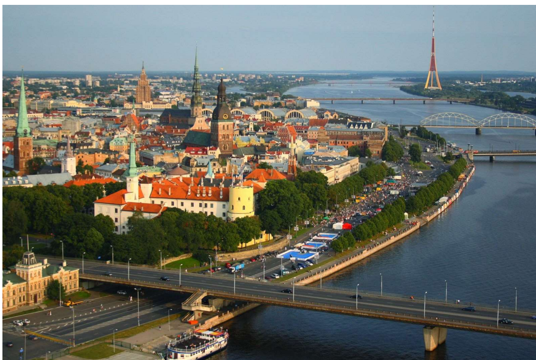
Foto Nr.16 Krastmalā sacensību laikā pulcējas daudz skatītāju.