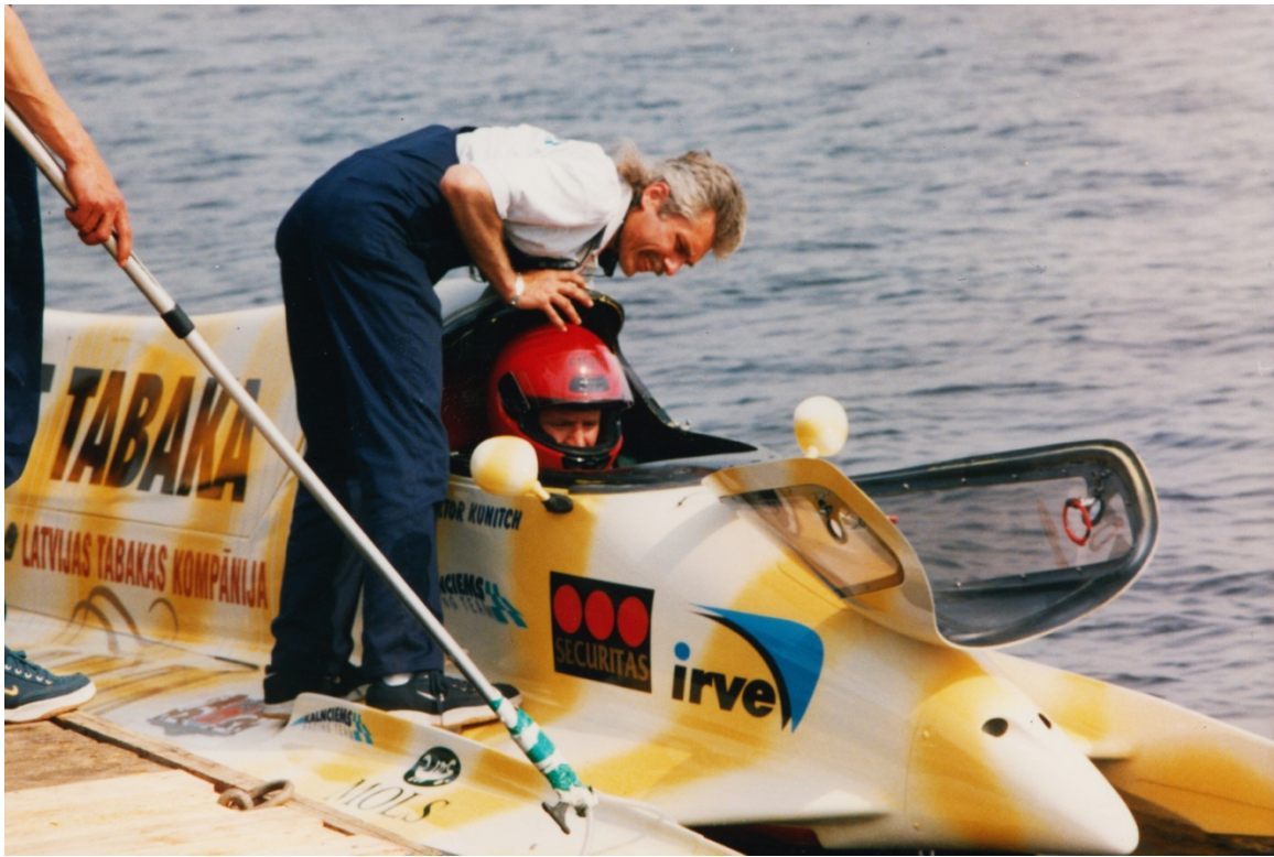
Gatavojot startam F-1 pilotu