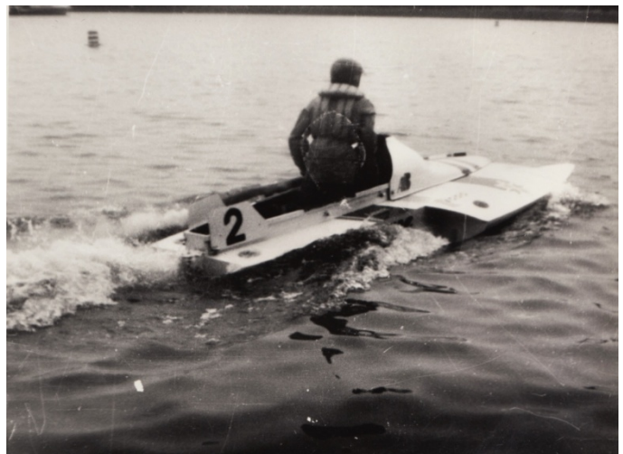
Ar gliseriem startēja 33 gadu vecumā, protams vispirms ar mazākajiem