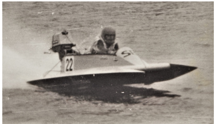
Pašbūvētais katamarāns skrēja ātrāk