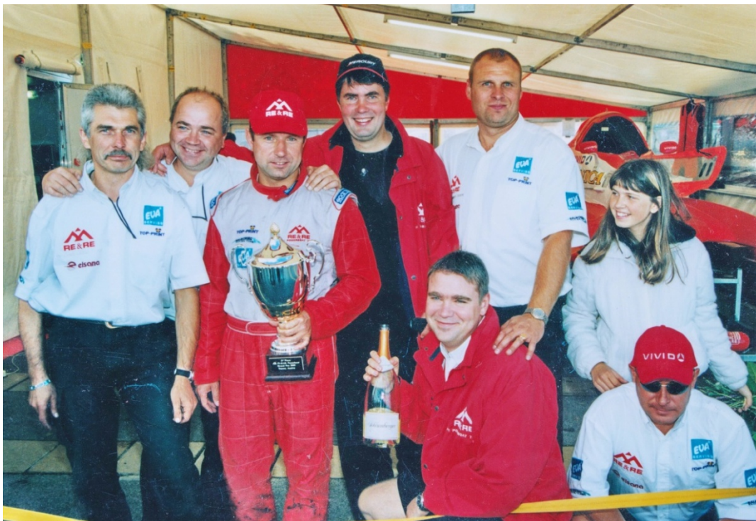
Komanda, kas īstenoja sapni par Formulu-1 uz ūdens Latvijā