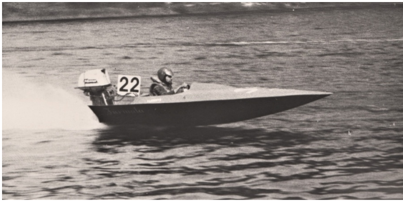
Ar V-veida laivu braucot veidojās koordinācija.