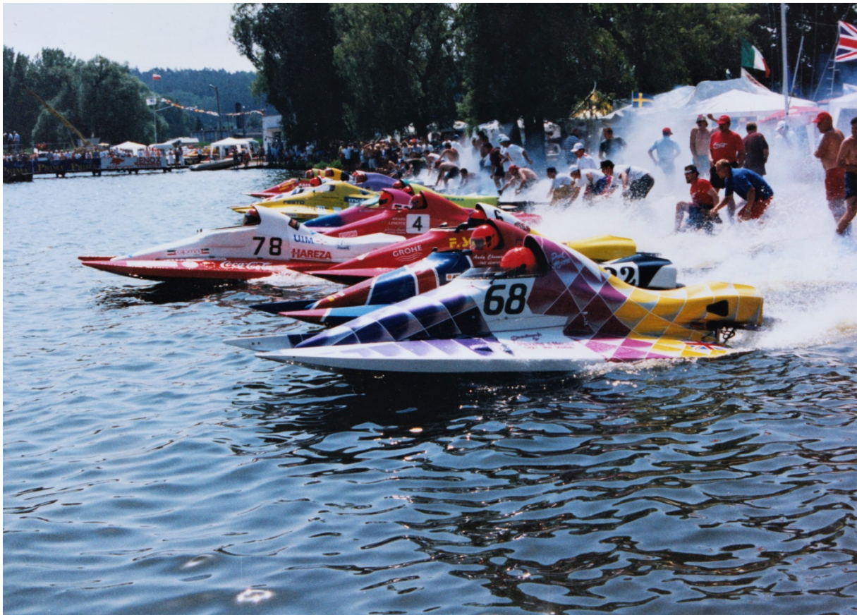
Starts F-500 klasē