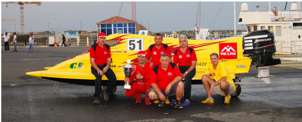
Fudžeira, Apvienotie Arābu Emirāti 2009.g. – Uvis Pasaules Vicečempions