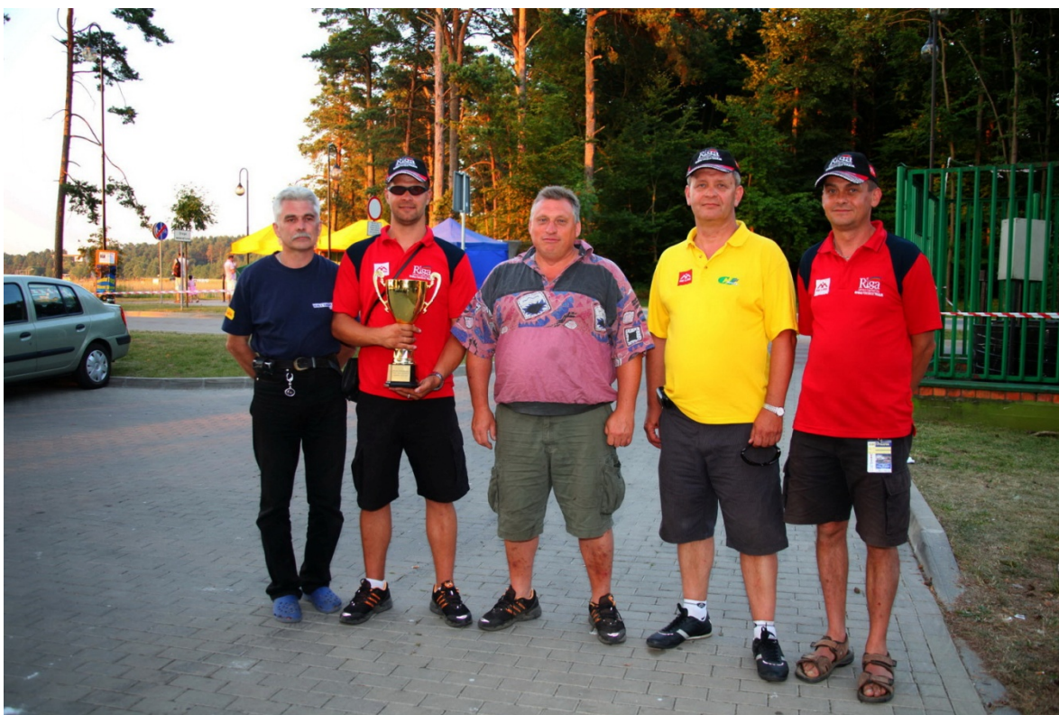
Komanda pēc 8 stundu maratona sacensībām Augustovā – Polijā