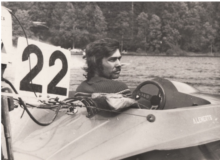
Pēc vajadzība dažādās sacensībās lietoja atšķirīgas laivas.