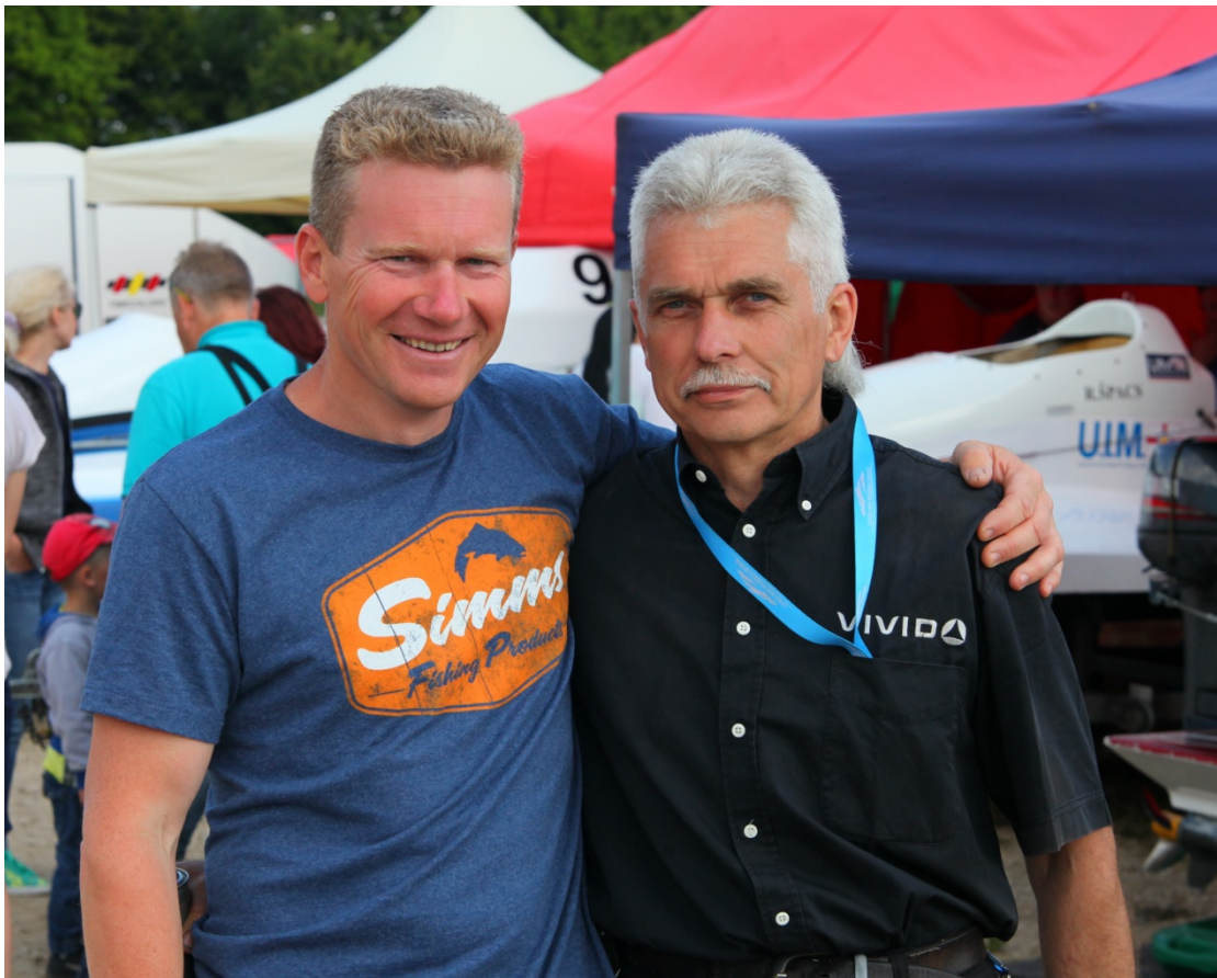
Ar Aivaru Lenertu Alūksnē 2015.gadā