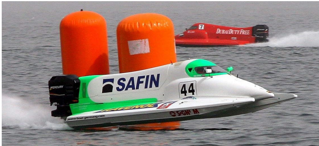
Ar F2000 Fudžeirā 2008.g.