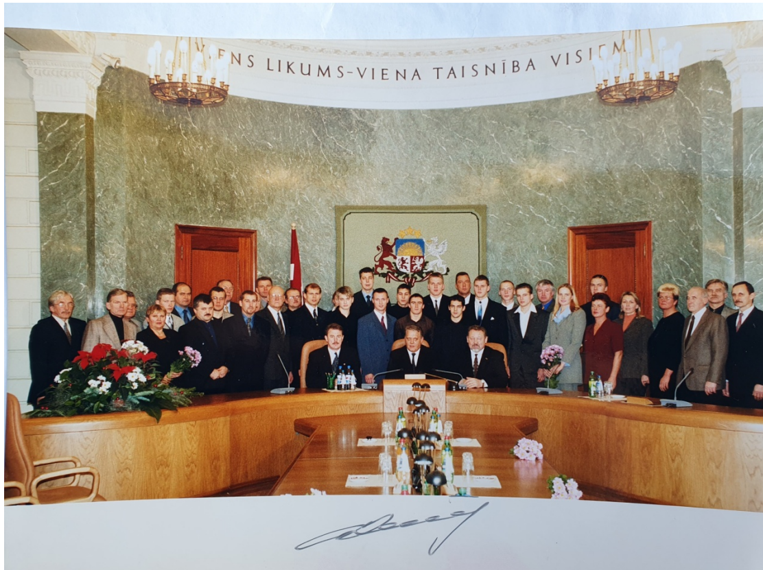
Pieņemšana pie Ministru prezidenta 2004.gads