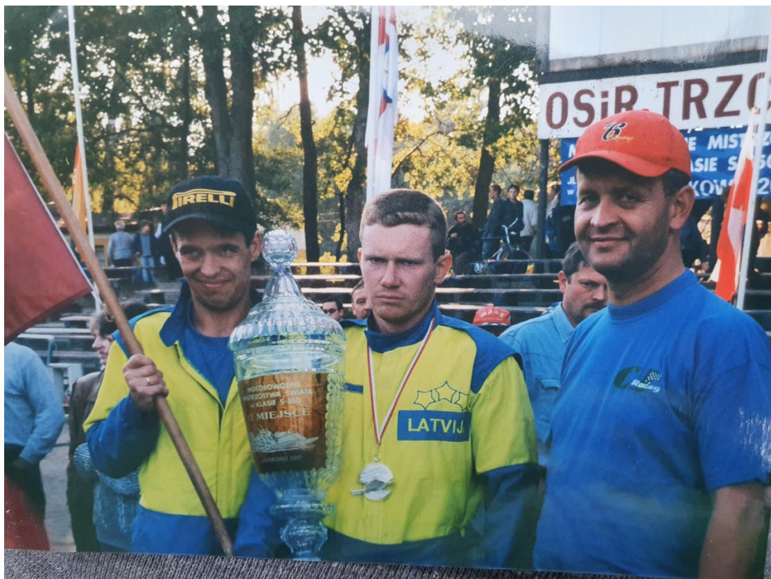
Pasaules čempionāts Polijā 2001.gads 2.vieta