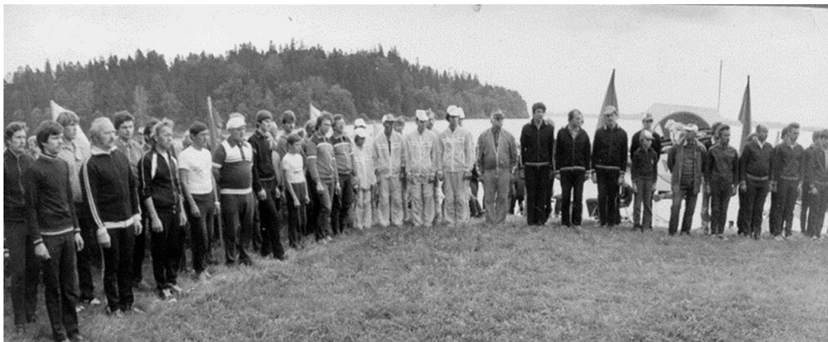
Žurnāla „Zvaigzne” ceļojošā kausa izcīņas sacensību atklāšanas parādē Alūksnē, 1983.gads