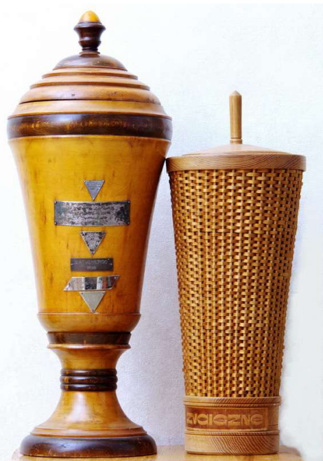
Žurnāla „Zvaigzne” 1959.gada 15. jūlija Nr.13.