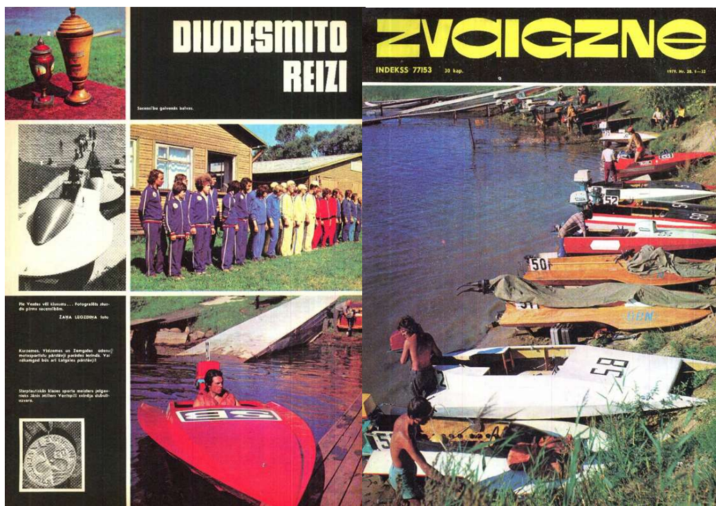
Žurnāla „Zvaigzne 1979. gada 15. oktobra Nr.20. 24. un 34. lapa