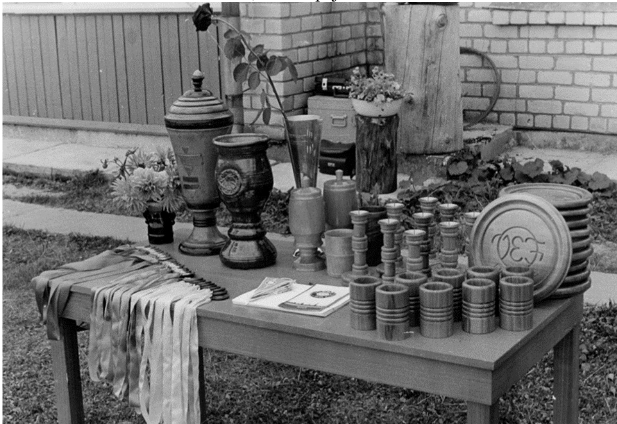
Žurnāla „Zvaigzne” ceļojošā kausa izcīņas balvas sacensību godalgoto vietu ieguvējiem Alūksnē, 1983. gads