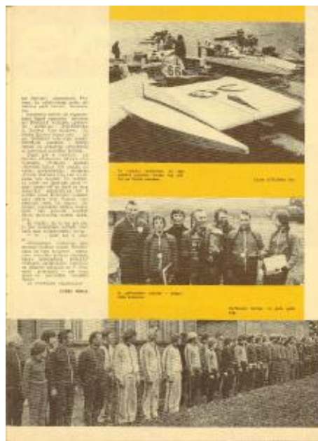
Žurnāla „Zvaigzne” 1980. Gada 15.septembra Nr.18. 33. lapa