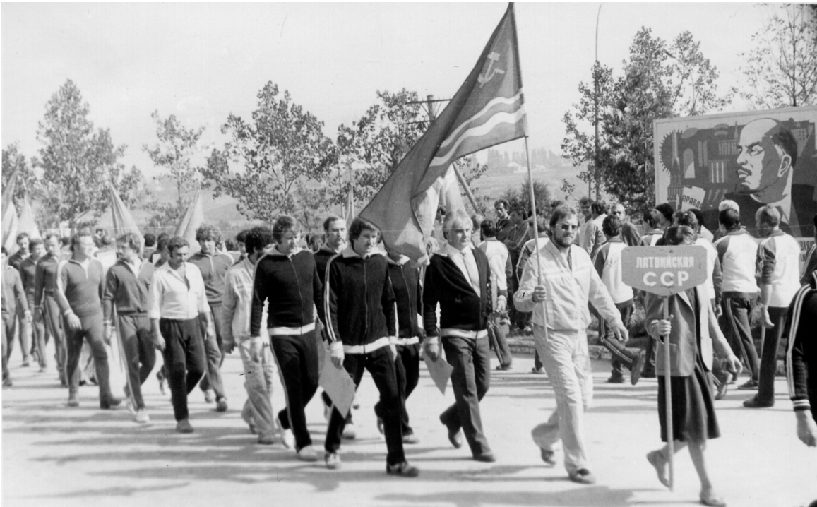
Sacensību noslēguma parādē Grozņijā.