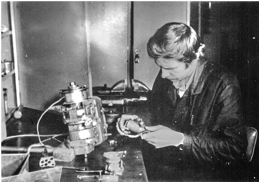
Aigars pie darbgalda VEF cehā Alūksnē

„Tolaik nebija kā tagad, ka viss jāpērk par savu naudu. Strādāju rūpnīcas VEF filiālē 14.cehā Alūksnē par remontatslēdznieku brigadieru un bijām vefiešu komandā. Darba vieta neliedza cehā izgatavot detaļas, VEFs nopirka man laivu „Danish” un motoru „Vihr”- tādā ziņā bija daudz vieglāk. Bija pat tā, ka algoto darbu darīju mazāk, nekā ķimerējos ar saviem dzelžiem.