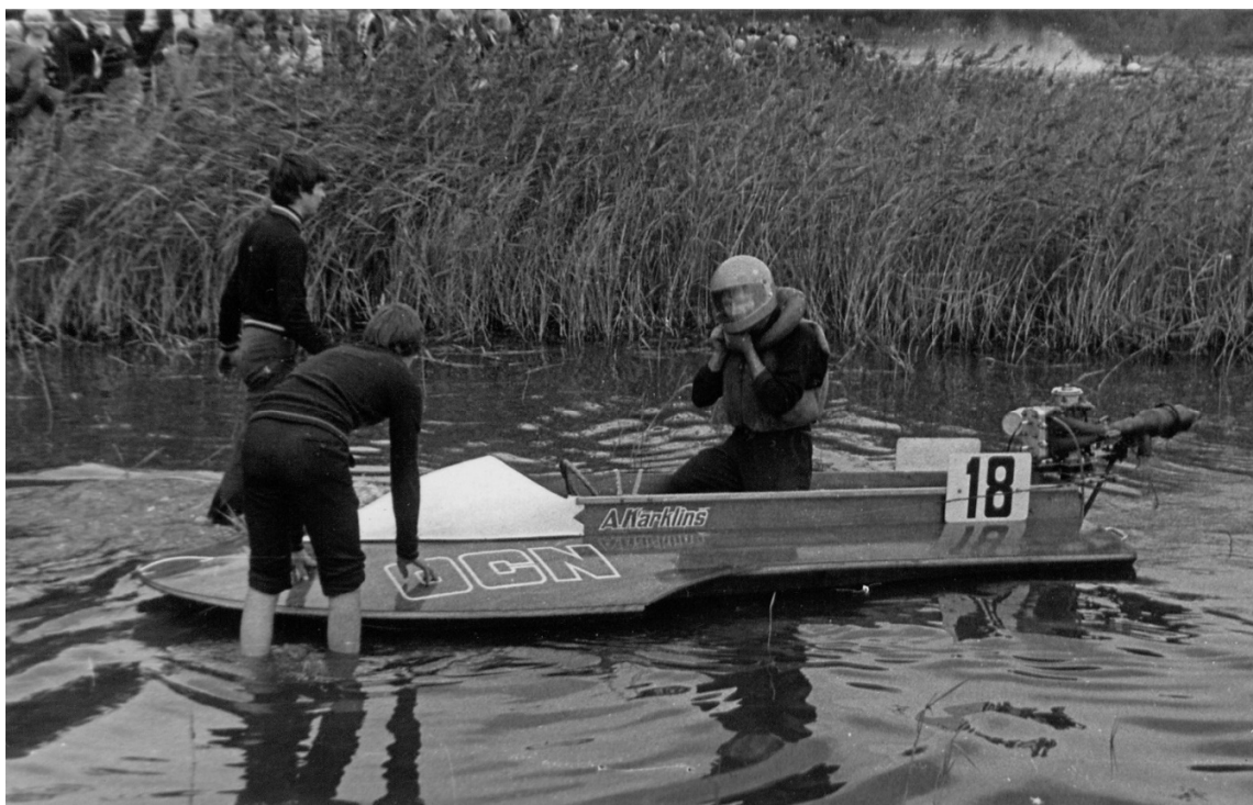
Pēc finiša sacensībās Alūksnē