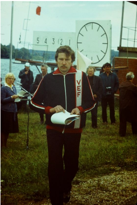
Pēc apbalvošanas Skrīveros Stučkas rajonā (Latvijas PSR čempionāts).