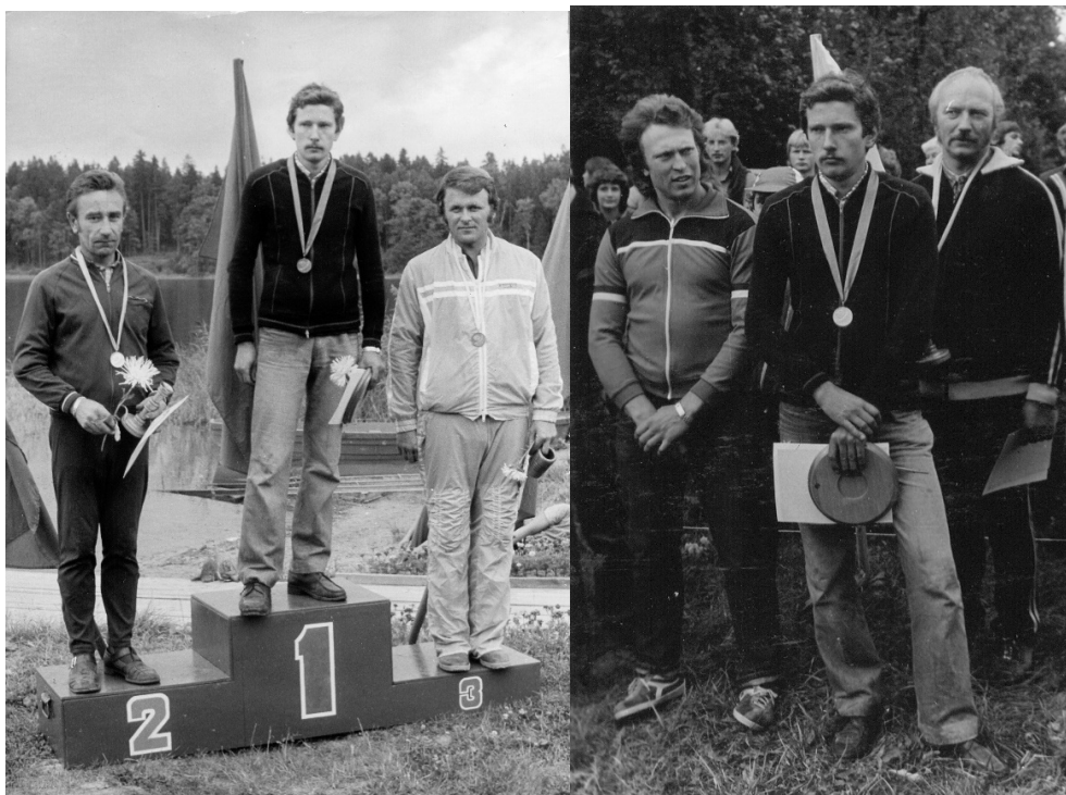
A. Kārklis šancensībās Alūksnē