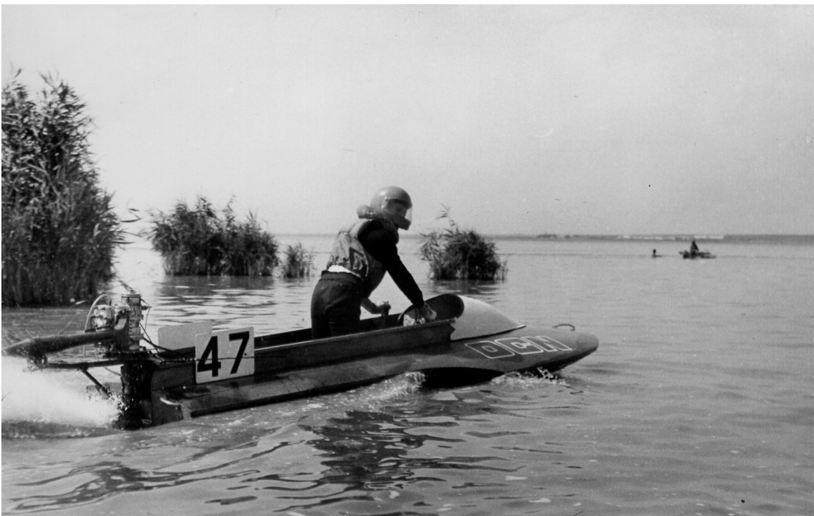
Uz startu sacensībās Budjonovskā (Latvijas PSR izlases sastāvā).