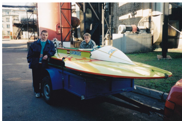
2002.gada rudens un 2003.gada pavasaris