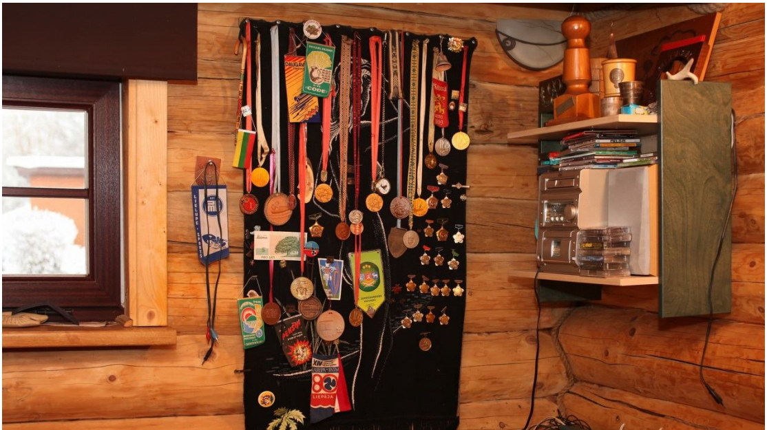
Foto Nr.17 Pirtiņā pie sienas sacensībās izcīnītās Arņa Pūces trofejas.