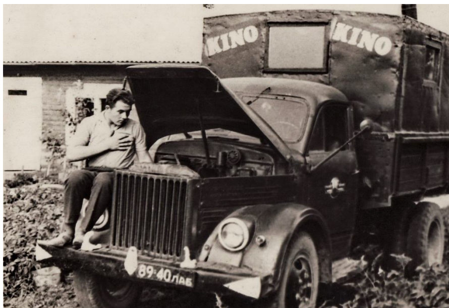
Foto Nr.4 Kaut paspētu laikā! – Ne vienmēr auto klausīja, bet cilvēki gaidīja.