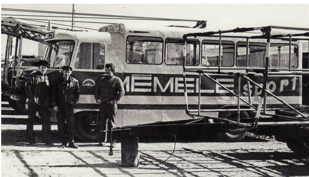
Foto Nr.8 Tehniskās apskates ierindā atjaunotais komandas autobuss. No kreisās: Igors Mokrijs, Juris Ģelze, Arnis Pūce;