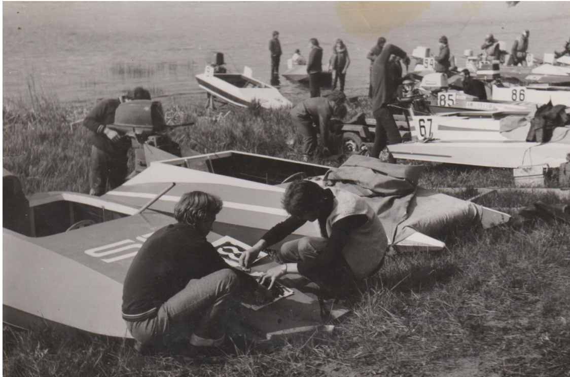
Indulis Graudužis palīdz Edmondam Lavrenovam uzkrāsot starta nummuru.