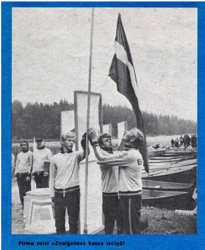
Pirmo reizi «Zvaigznes» kausa izcīņā!

“ Mūsu redakcijas ceļojošā kausa izcīņa ūdens motosportā notika jau 31.reizi. Taču pirmo reizi šā starprepubliku mēroga sporta sacensību atklāšanas parādē,