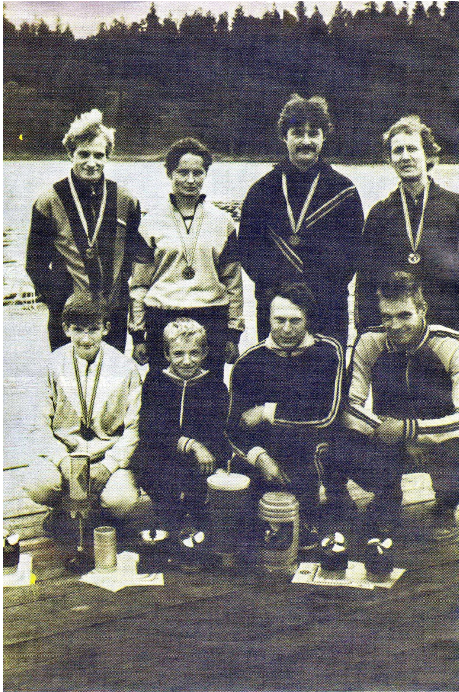
Šogad galvenās balvas — jelgavniekiem!