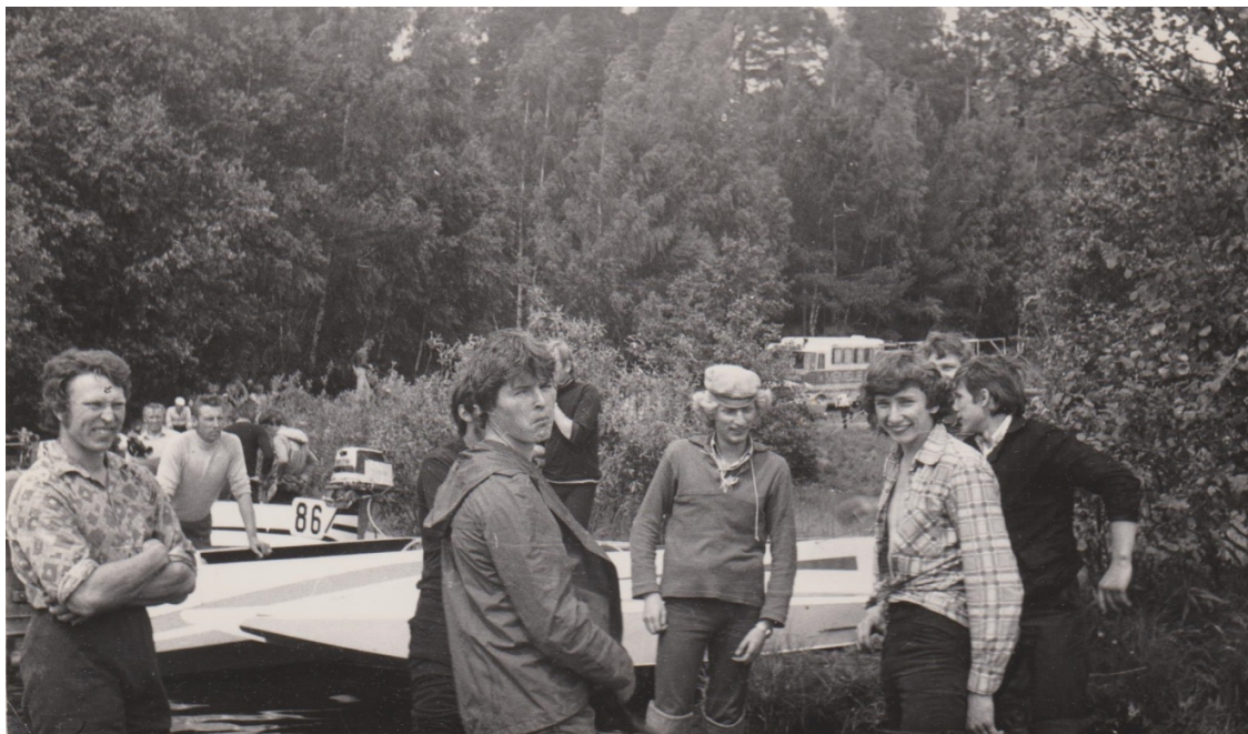
Brīdis pirms starta.....