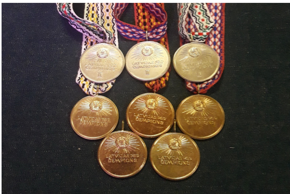
Unikāli - E.Lavrenova Latvijas čempionātos OCN-500 skuteru klasē 5.gados izcīnītās 5 Čempiona un 3 Vicečempiona medaļas.