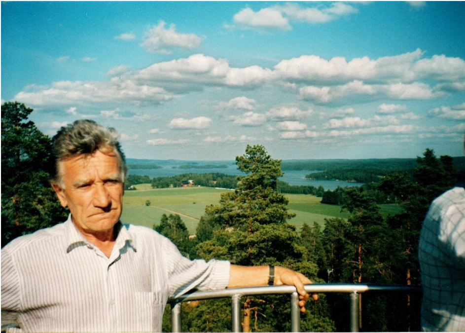
Autobusa vadītāja darbs dod iespēju daudz kur pabūt un daudz iepazīt.

Ar autobusu apbraukāta un apskatīta visa mūsu Latvija.