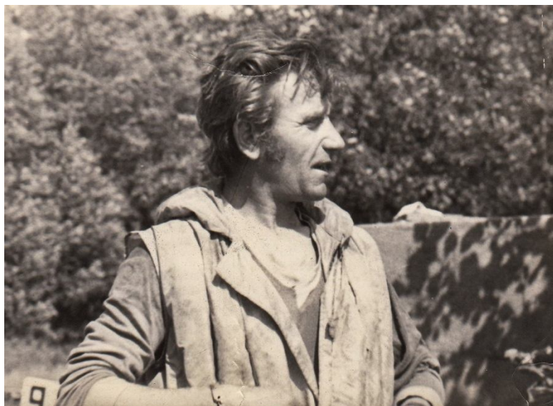
No arhīva – sporta gaitu sākumā.