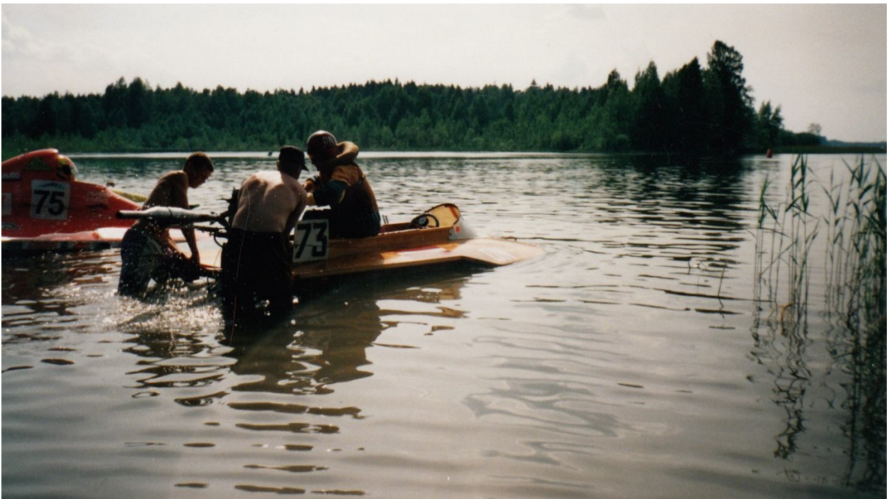
Forsēts motors braucienu var sākt, kad tas iedarbināts un uzņēmis vajadzīgos apgriezienus, komandas biedriem skutera pakalgalu pieceļot, lai dzenskrūve būtu virs ūdens.