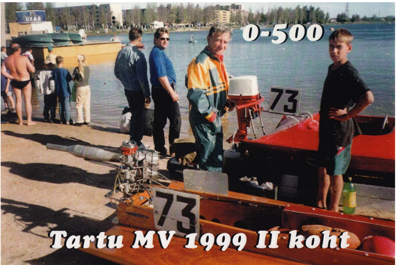
Tartu MV 1999 II koht