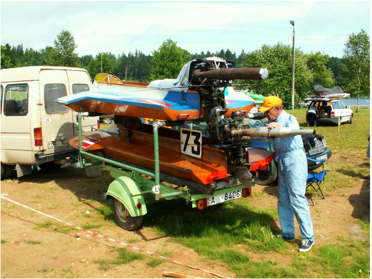
Tehnika uz un no sacensībām jātransportē uzmanīgi – no tā atkarīgi rezultāti.