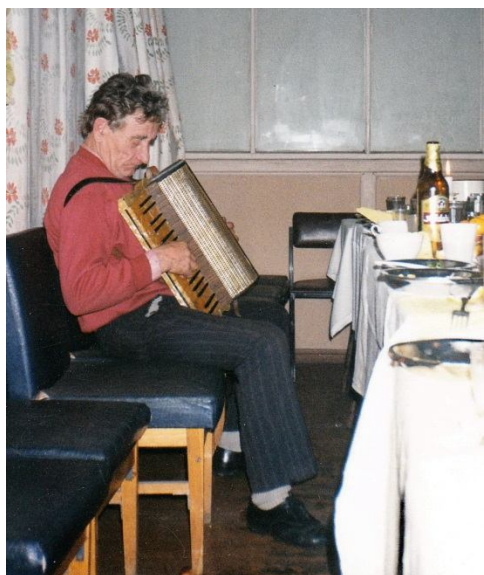
Ne katru akordeons klausu.