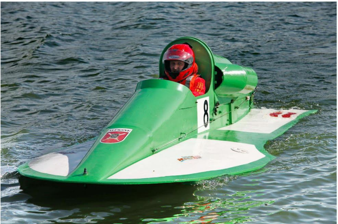
Glisera krāsojums veikts, attīstot Gata pirmo skuteru dizaina tēmu.