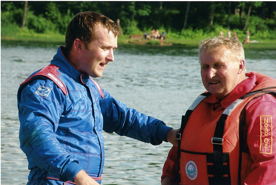
Apspriede ar dēlu pēc brauciena gliserī. 2009.gads, Alūksne.