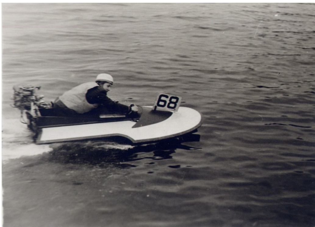
Gatis distancē ar skuteri SA-250 cm 3 Nr.68 1961.gads