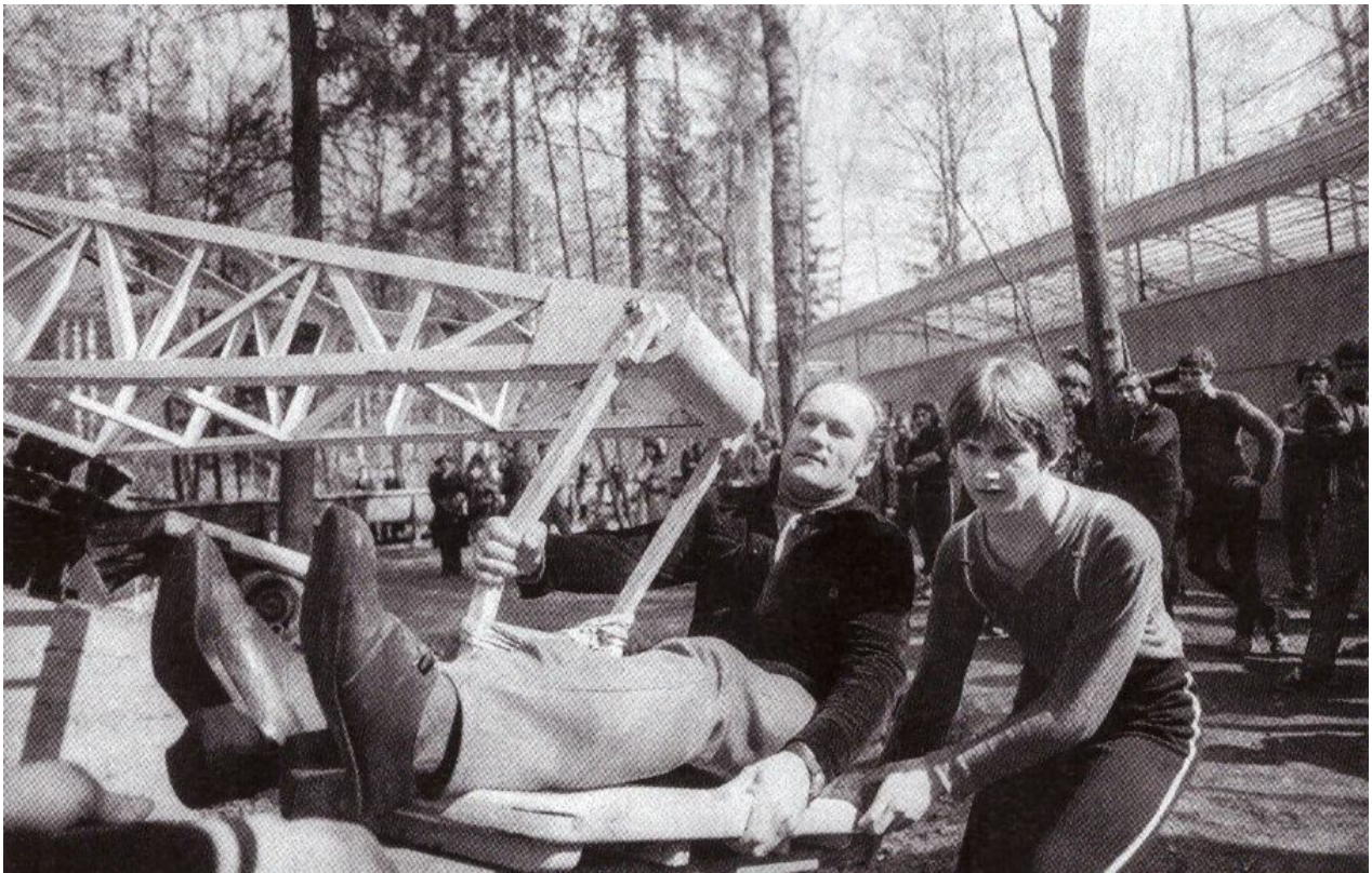
Pirmais nākošo bobslejistu tests 1980.gadā Murjānos.