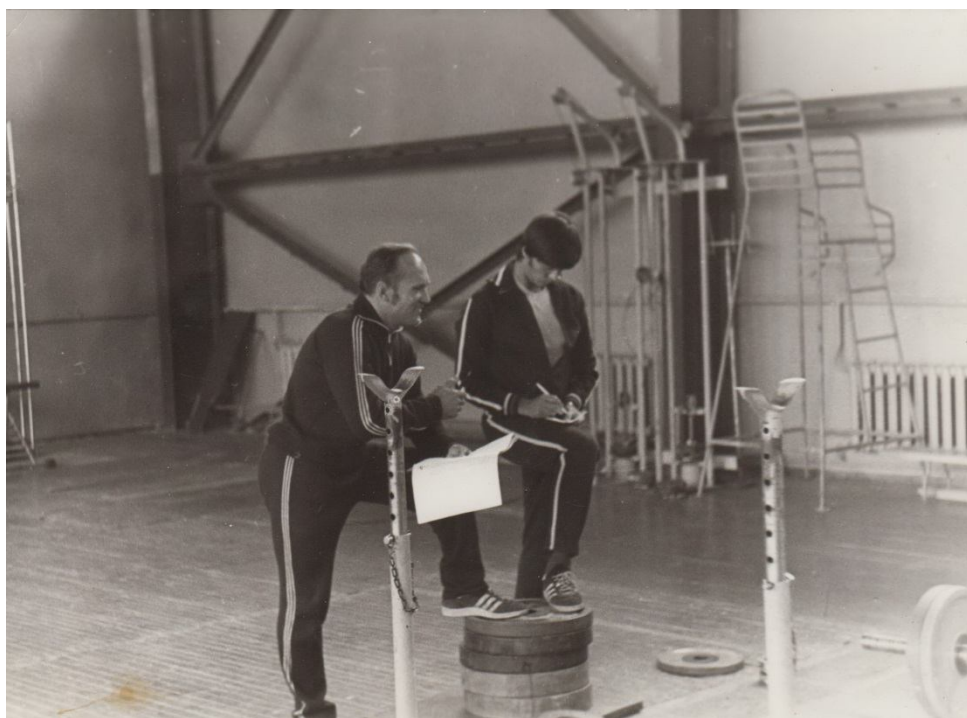
Sporta zāle – neatņemama bobsleja sastāvdaļa.