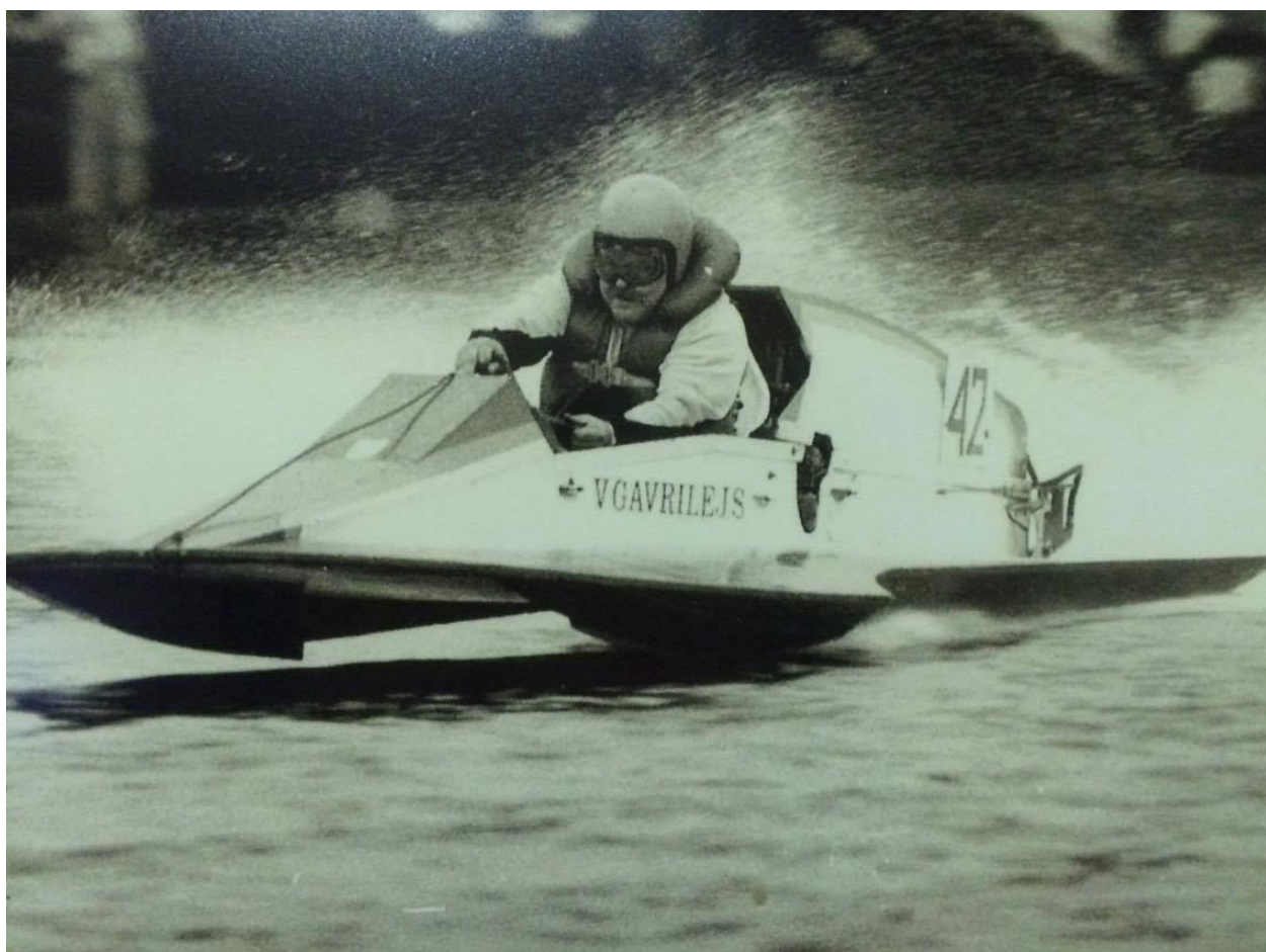
1987.gadā izcīnija PSRS kausu R2 klasē.