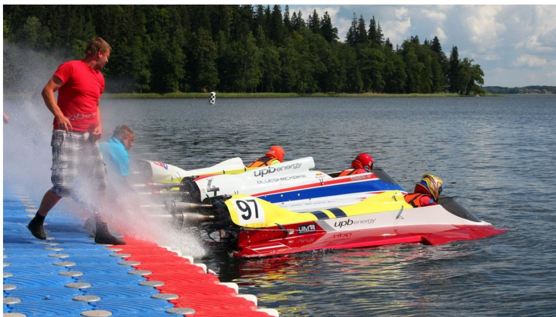
Skuteru starts Alūksnes ezerā. 2015.gads.