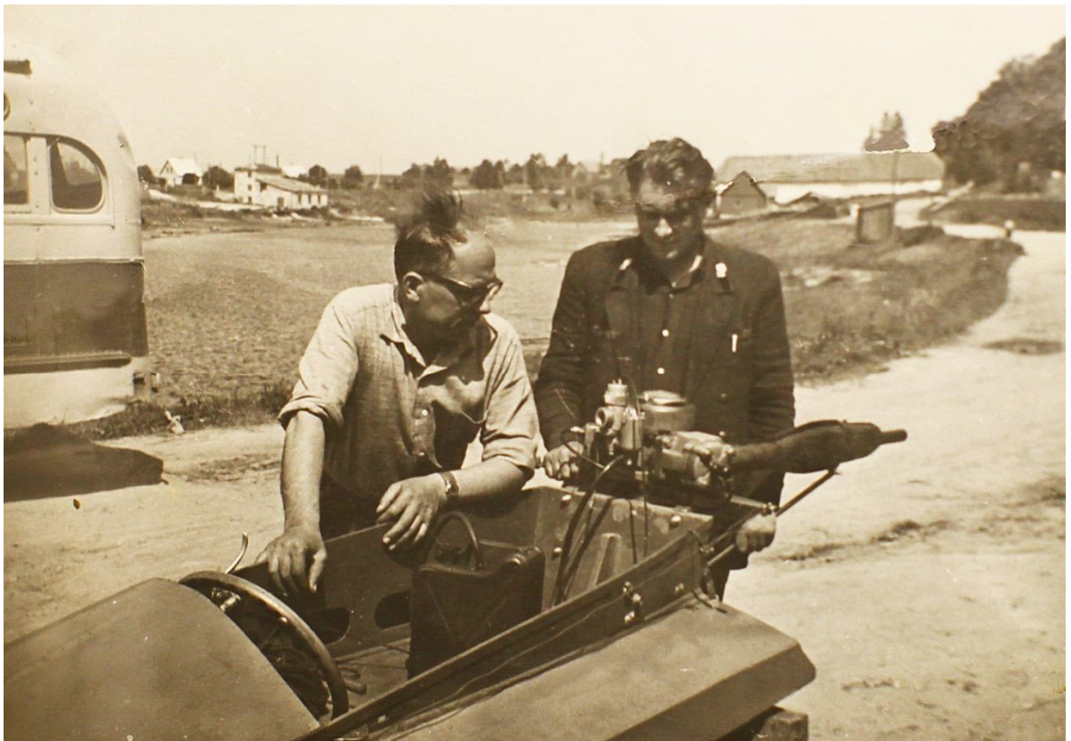
Pie auduma virsas skutera ar benzīna „Delfīnu” 175cm 3