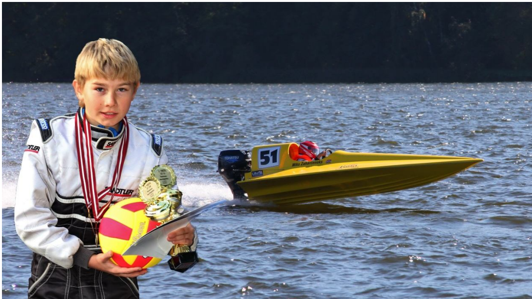
Dēls Miks jau no mazotnes startējis Formula Future, JT-250 un GT-15 klasēs.