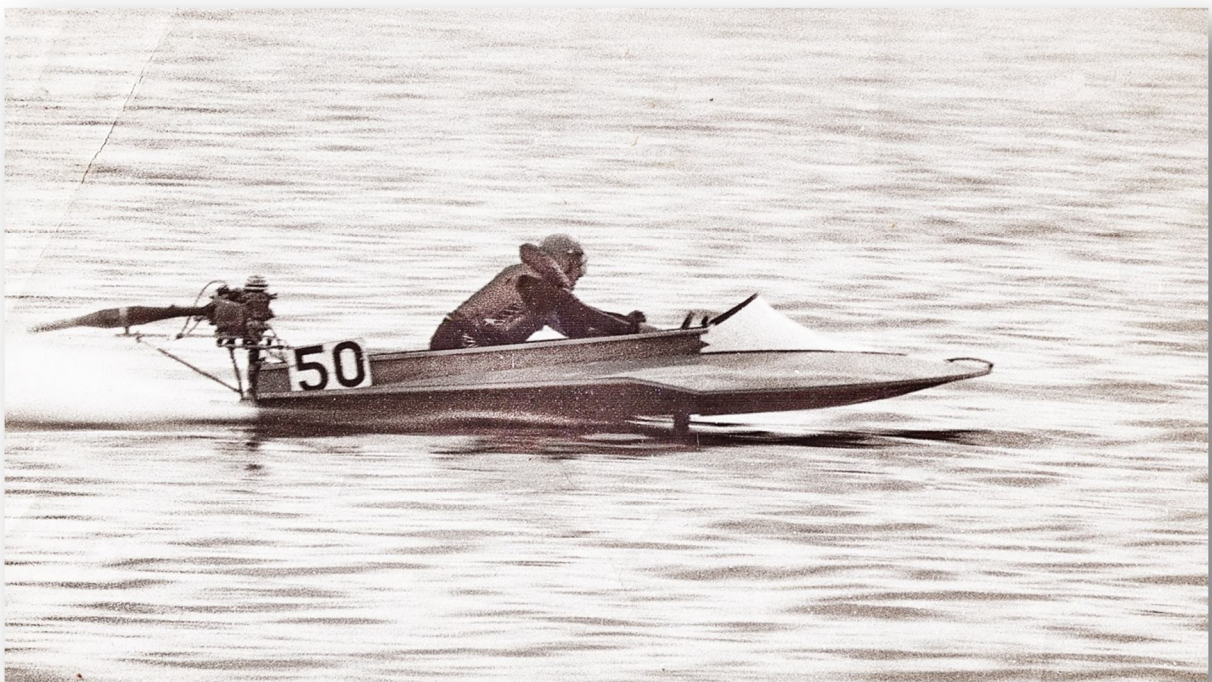
Miervaldi sacensībās var redzēt arī filmējam. F2 sacensībās nofilmētais vairākkārt bijis par pamatu tiesnešu lēmumu maiņai.