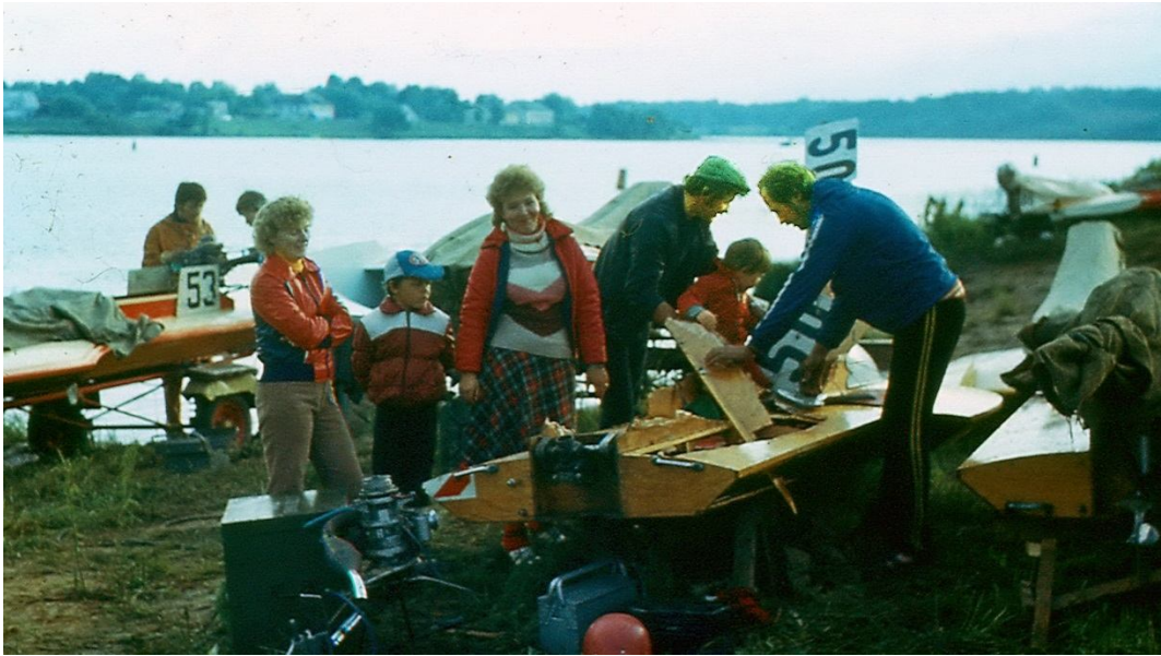
Ne vienmēr ātrais skrējieni beidzas laimīgi.