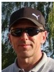
Materiālu sagatavoja: Andris Musts