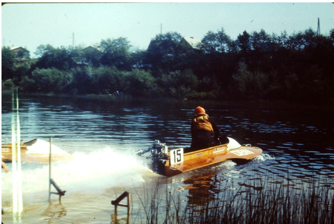
Kalvis dodas uz startu Bauskā kolhoza „Code” balvas izcīņai OBN klasē.