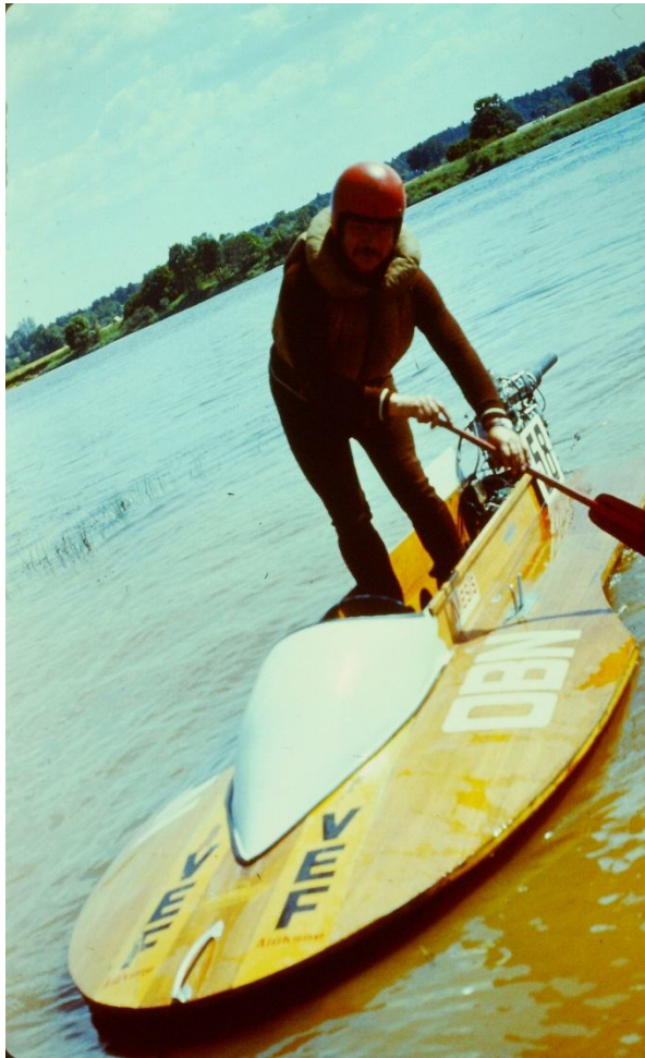
Arī airis reizēm noder.