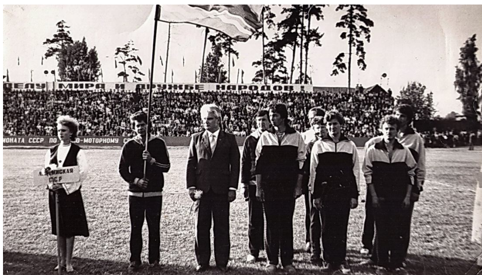
Republikas izlase Vissavienības Spartakiādes atklāšanā.