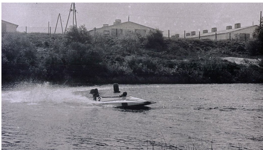
N.Jegorovs Codes sacensībās Mēmelē ar SB laivu.