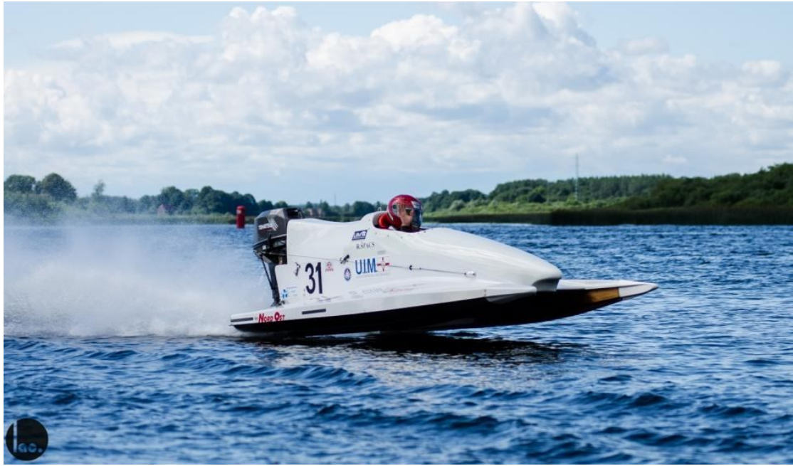
Sacensību mirklis S550