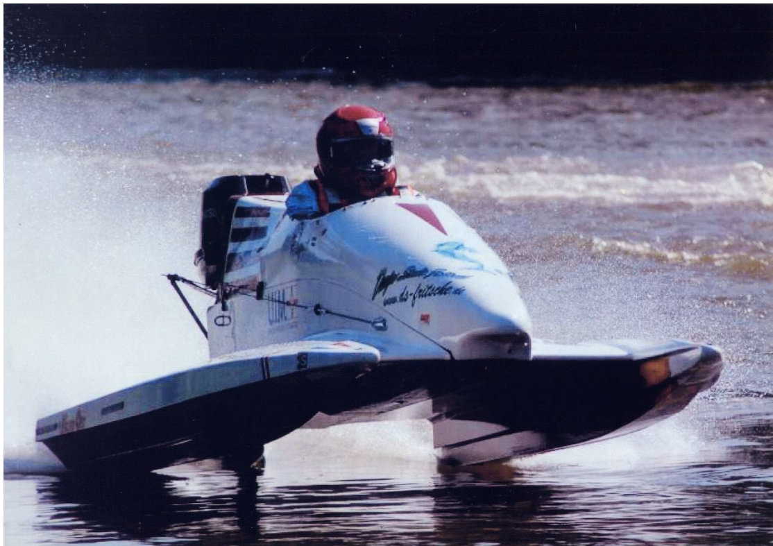
Raimonds trasē S 550