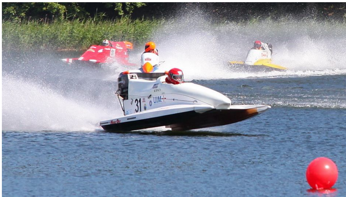
Sacensību mirklis Alūksnes ezerā 2015.gadā.