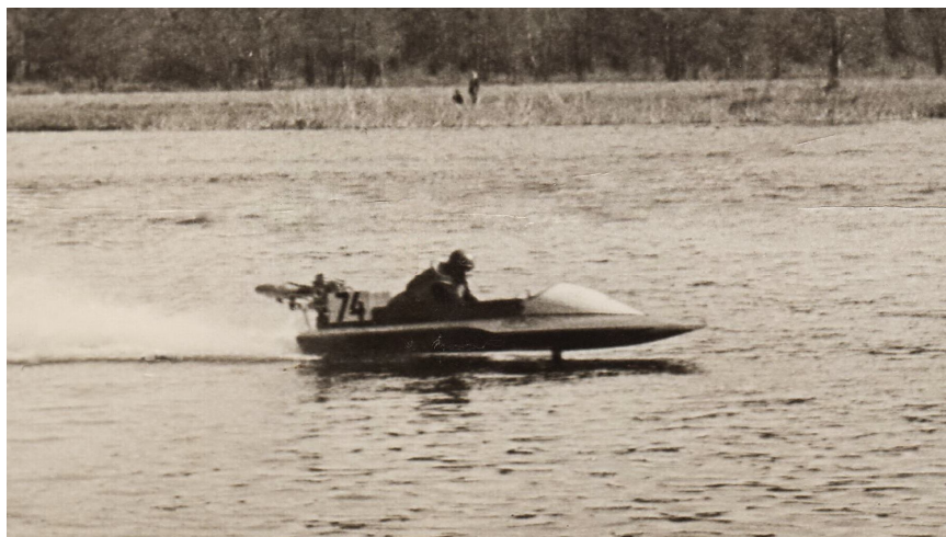
J.Rubenis ar skuteri OCN-500