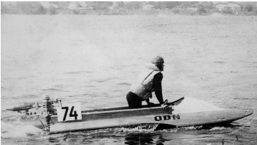
Arī OBN-350 ar „Privetu” skrien labi!