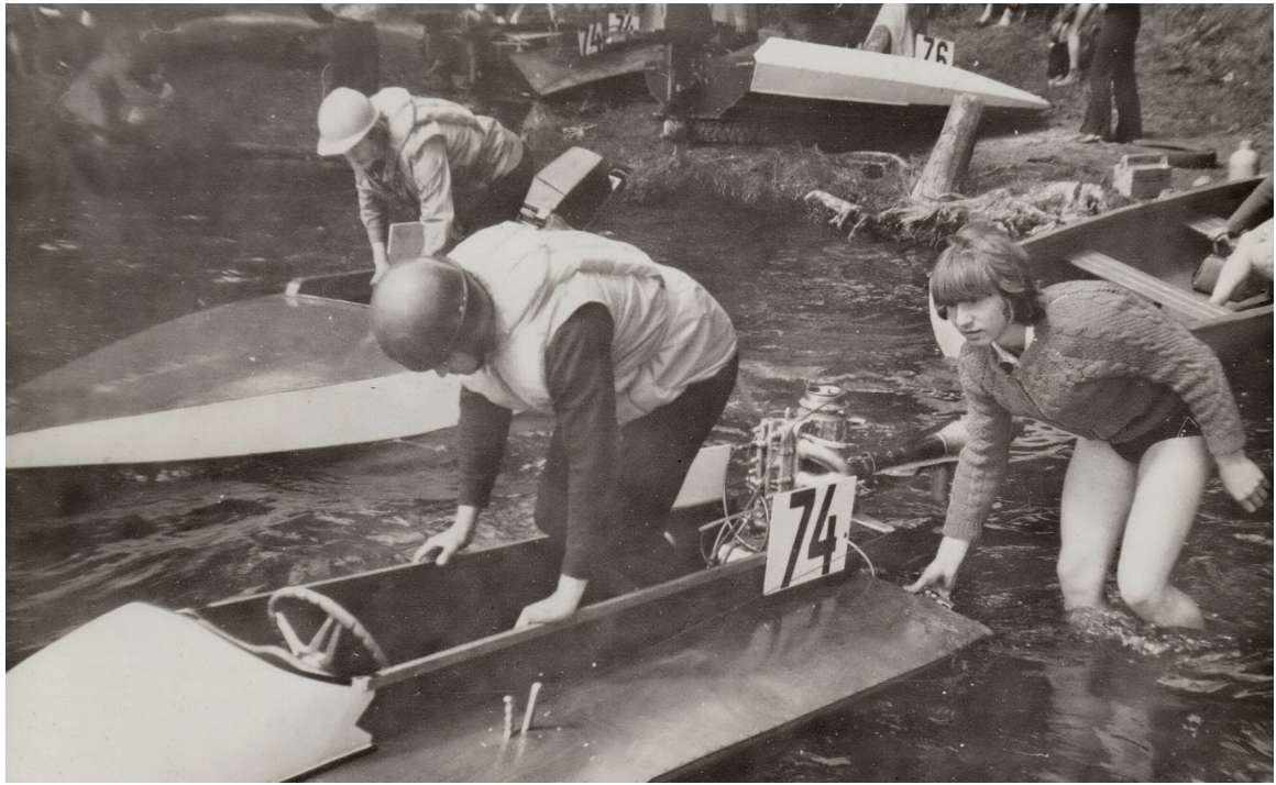
Nu var doties ūdenī, starts būs gaitā.