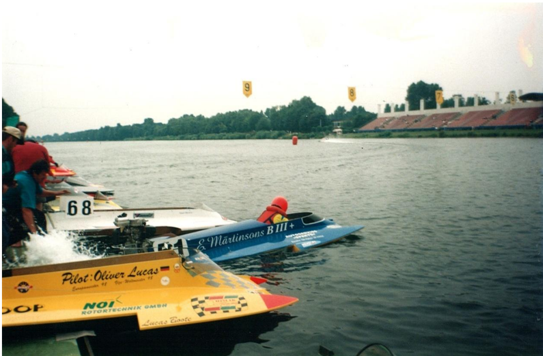
Zilais Ērika skuteris dodas treniņā Eiropas čempionāta trasē Duisburgā, airēšanas kanālā 1999.gadā.