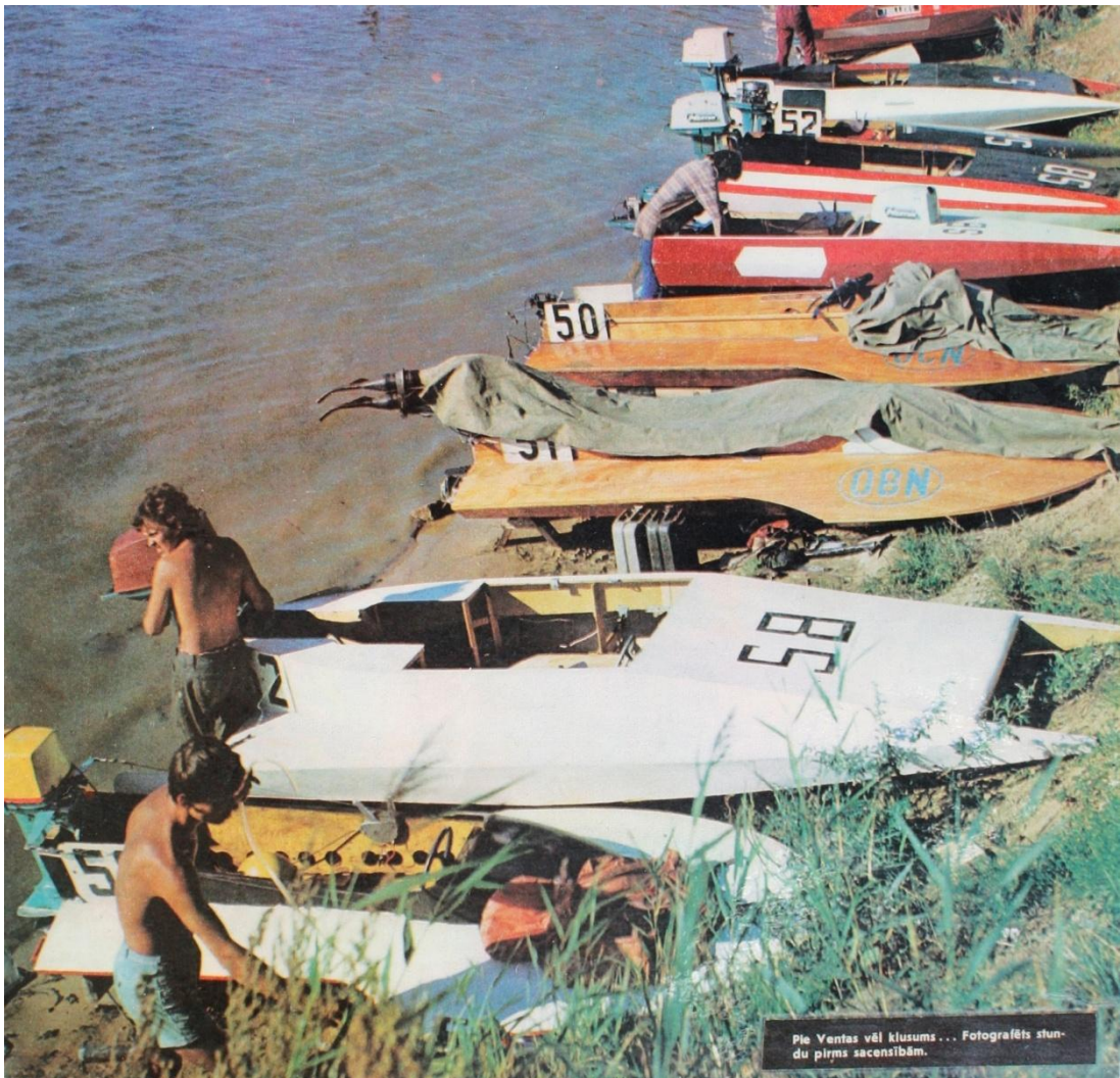
Ēriks gatavo savu pašbūvēto SB katamarānu žurnāla „Zvaigzne” balvas izcīņas sacensībām 1979.gadā Ventspilī. Fotogrāfijas daļa no žurnāla vāka.