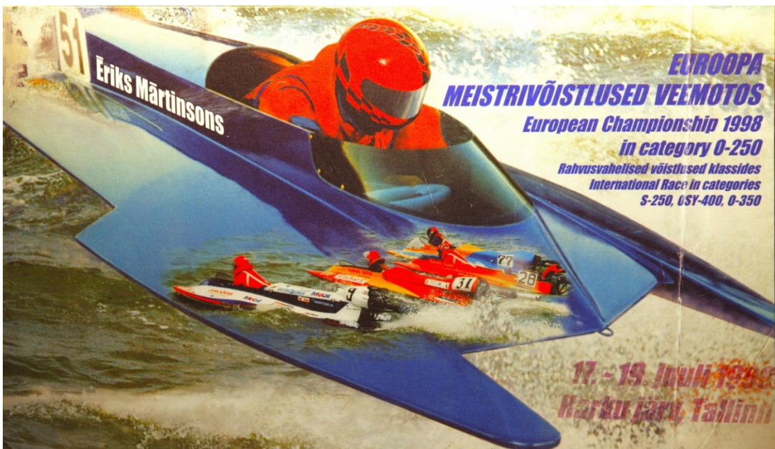
Ērika skutera vizuālais tēls tika izmantots uz skuteru OSY-400 Eiropas čempionāta afišas 1998.gadā Tallinā.