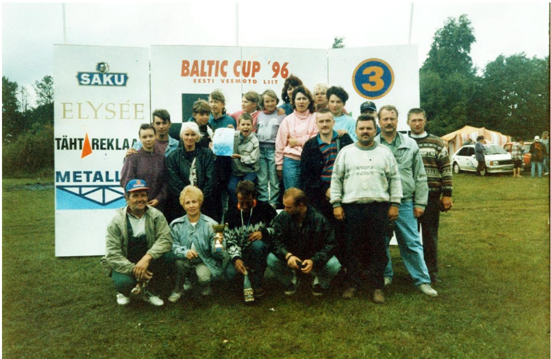
Igaunijā, Baltijas kausa izcīņas sacensībās 1996.gadā.